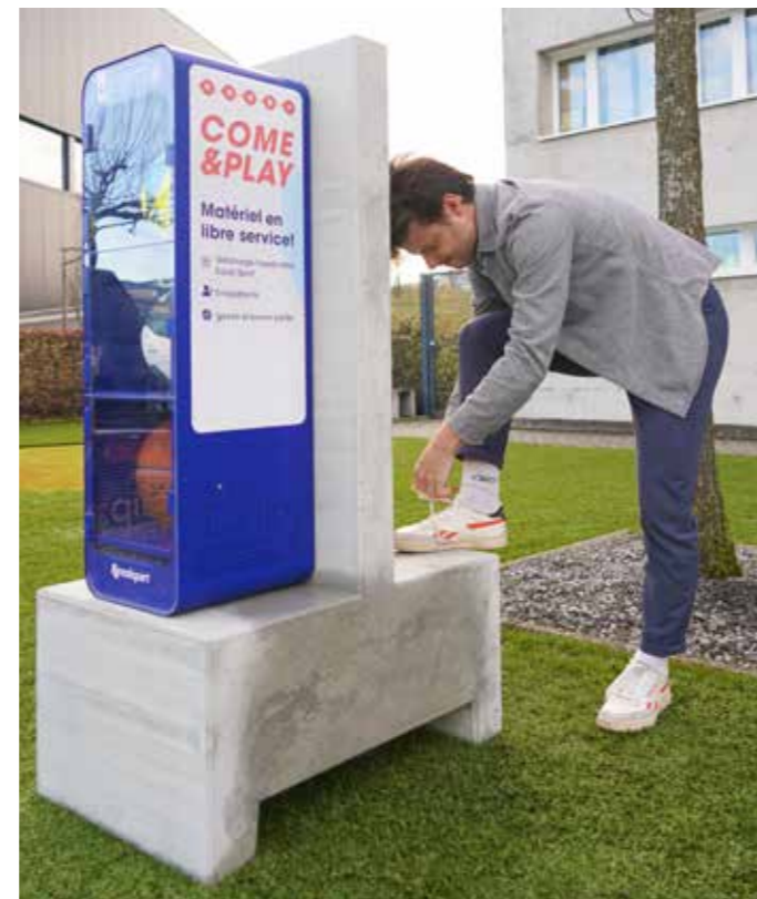
Exemple de casiers fixés sur un socle béton

L'avantage d'Equip est d'offrir des équipements de sports et de loisirs partout où l'on peut pratiquer.