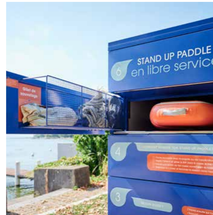
Ouvre ton casier et prends ton gilet, ta planche et ta pagaie.